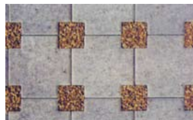
Disegno 1: con cubetti 10x10x8 cm posa a macchina possibile - resa: 16 pz/m 2