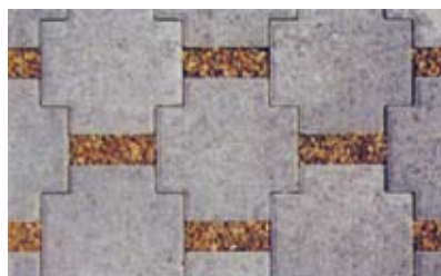
Disegno 3: sfalsati, posa a mano resa: 16,8 pz/m 2