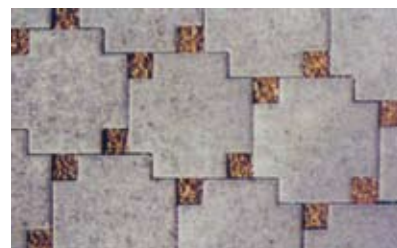
Disegno 4: sfalsati, posa a mano, i bordi vanno tagliati su misura - resa: 17,2 pz/m 2