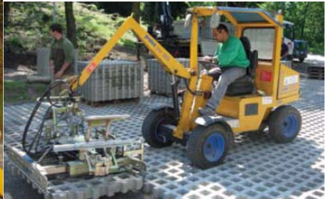
Pavimentatrice Agglomerati VM 203